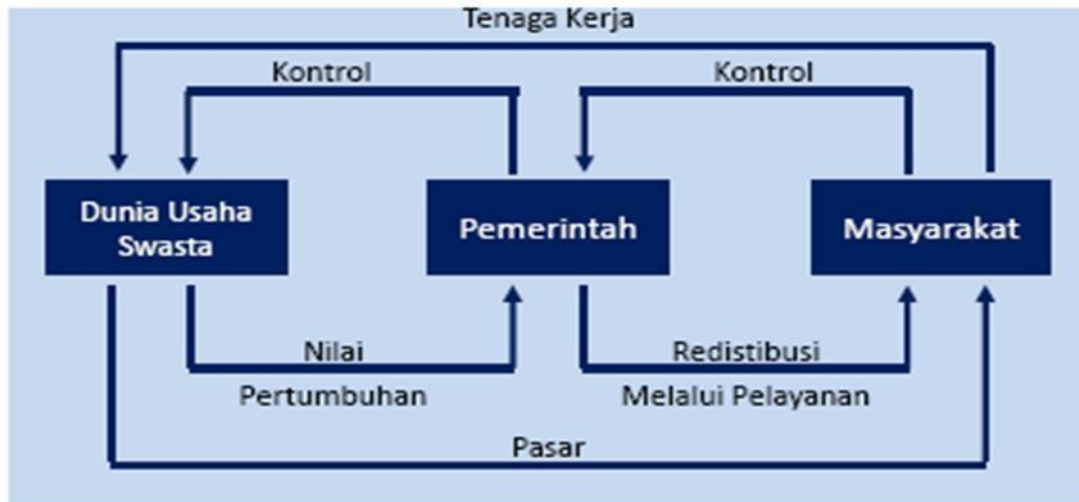
Gambar 2.1. Pelaku Pembangunan, Paradigma Governance